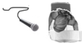
Ch2 - Veu 2 (Jordi)